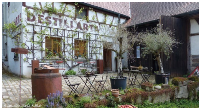
Galerie Destillarta, Roßtal

Im Pinderpark 5 • 90513 Zirndorf Kontakt@kunstverein-zirndorf.de • www.kunstverein-zirndorf.de Wechselnde Ausstellungen.