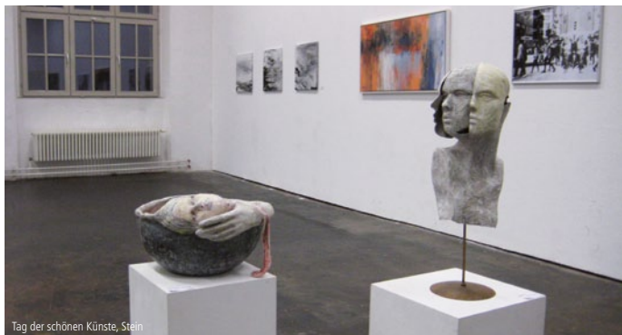
Tag der schönen Künste, Stein