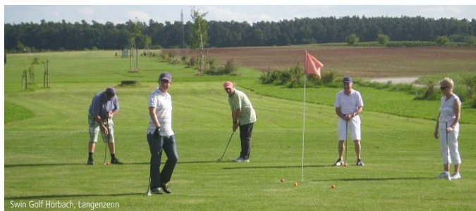
Swin Golf Horbach, Langenzenn