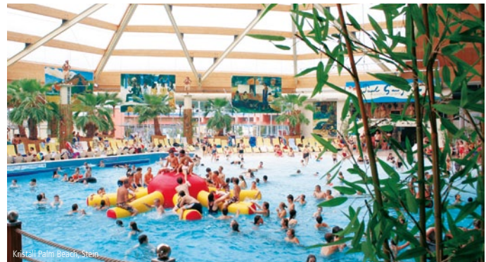
Kristall Palm Beach Stein