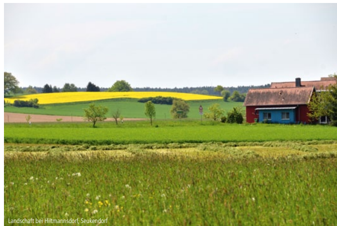
Landschaft bei Hiltmannsdorf, Seukendorf