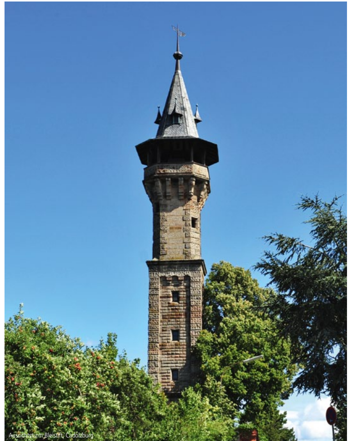
Aussichtsturm „Bleistift“, Cadolzburg

1980 wieder aufgebauter Turm mit Aussichtsplattform. Erinnerung an Walenstein's Schlacht an der Alten Veste 1632.