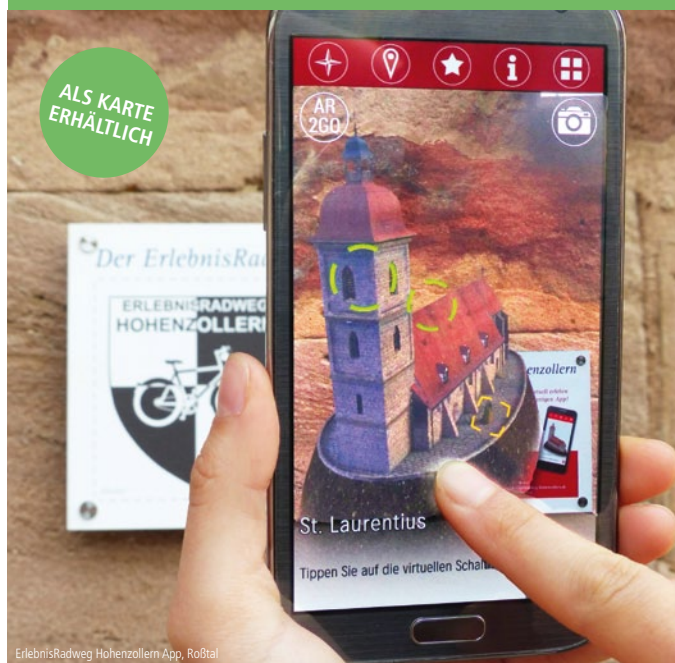
ErlebnisRadweg Hohenzollern App, Roßtal

Neben den genannten Touren ist der ErlebnisRadweg Hohenzollern ein besonderes Highlight. Bei diesem rund 95 km langen Themen-Radweg von Nürnberg bis Ansbach erhalten Sie spannende, virtuelle Einblicke in die Geschichte der Hohenzollern in der Region. Weitere Informationen: www.erlebnisradweg-hohenzollern.de