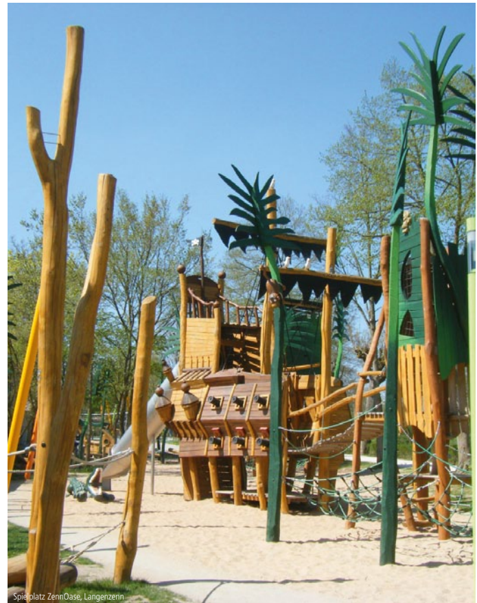
Spielplatz ZennOase, Langenzenn