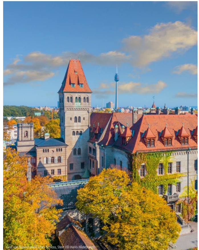
Graf von Faber-Castell'sches Schloss, Stein

Bleistiftschloss als Zeugnis aristokratischer Wohnkultur aus der Zeit um 1906 mit weitläufigem Schlossgarten. Museum und Führungen.