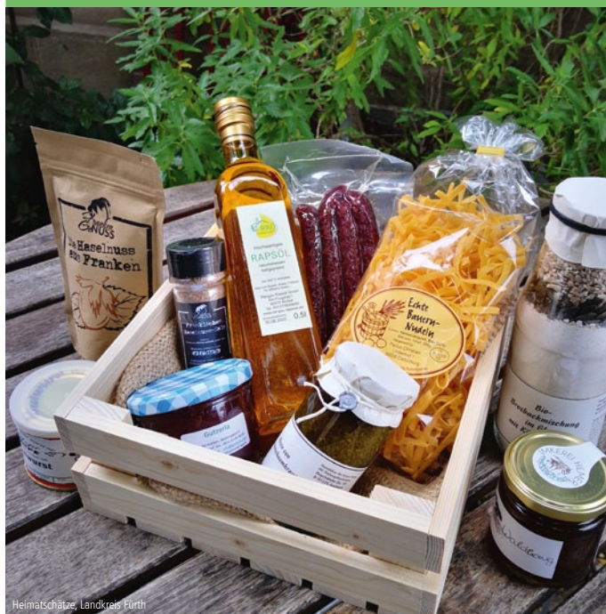
Heimatschätze, Landkreis Fürth

Auf der Suche nach einem Geschenk oder Mitbringsel aus dem Landkreis Fürth? Die Heimatschätze vereinen in drei Themenkisten/-taschen eine Auswahl an regionalen Spezialitäten von den Direktvermarktern vor Ort. Bestellungen und weitere Informationen unter www.hofladenbox.de