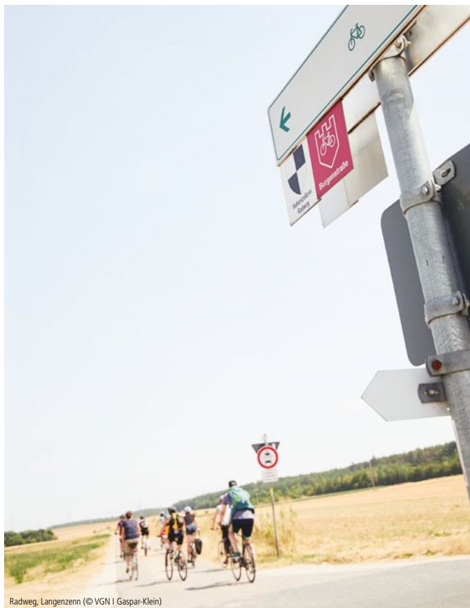
Radweg, Langenzenn